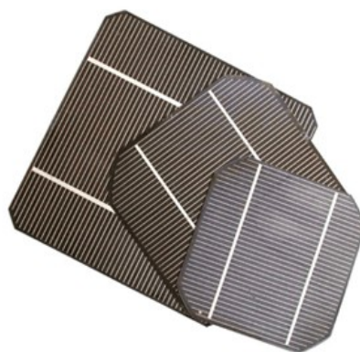
Illustrazione 7: celle fotovoltaiche

L'Italia ha aderito al protocollo di Kyoto sulle emissioni di agenti inquinanti in atmosfera. Il paese si è impegnato a ridurre le emissioni di CO2 rispetto a quelle del 1990. L'obiettivo fino ad ora è stato mancato e anzi, le immissioni sono salite del 9,9%, 75 milioni di tonnellate, che costano al paese un debito di oltre 4 milioni di euro al giorno (4,1 milioni di euro). Per la precisione, dal 1° gennaio 2008 il debito è di 47,6 € ogni secondo e diventeranno quasi 1,5 miliardi di euro a fine 2008.