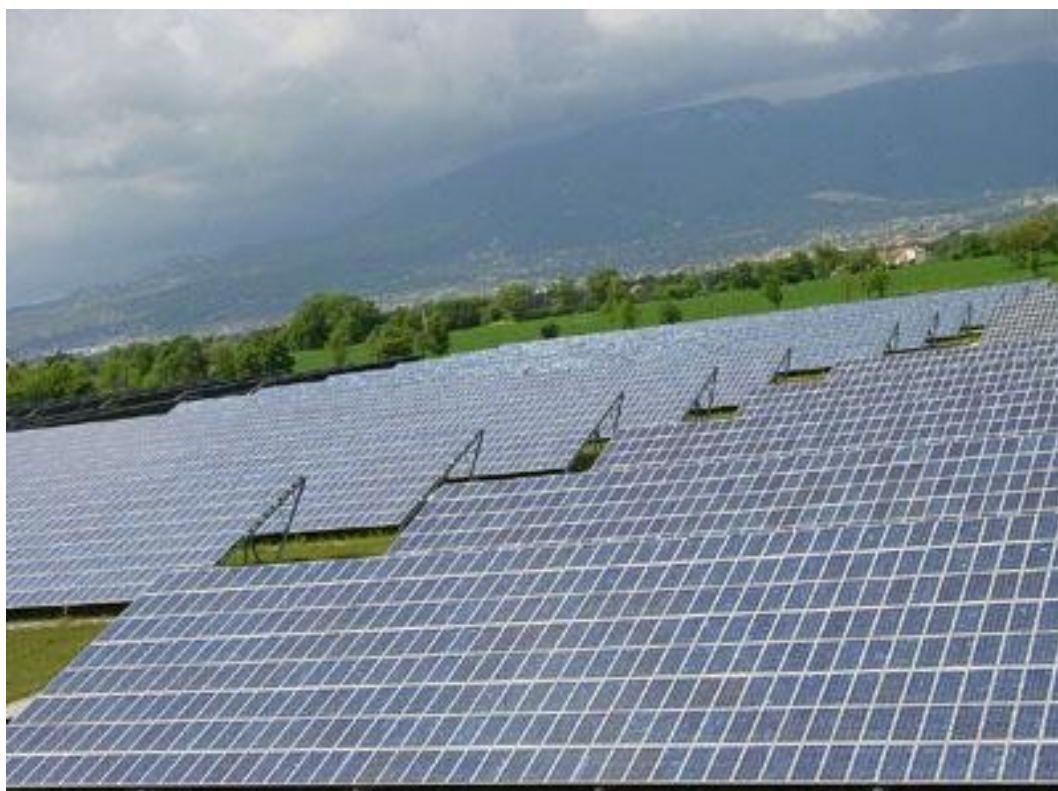
Illustrazione 4: altro esempio di "campo" fotovoltaico