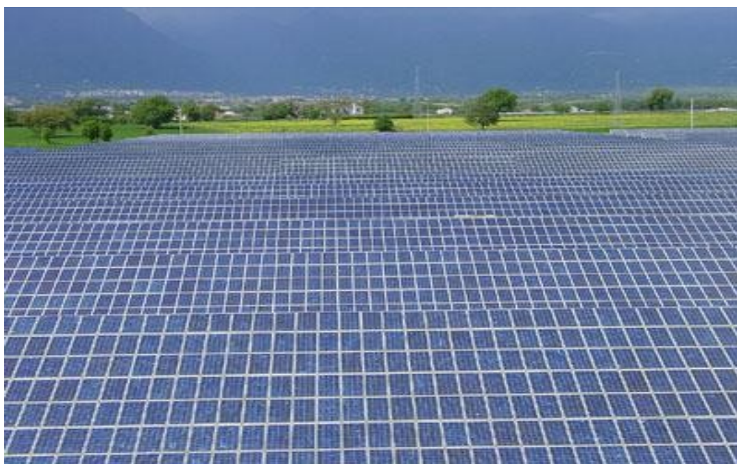
Illustrazione 2: esempio di veduta di un "campo" fotovoltaico

La differenza nel totale dei 75 impianti e dei 20 anni è di circa 135 milioni di euro. La differenza è anche di circa 5 milioni di euro all'anno sul totale dei 75 impianti.