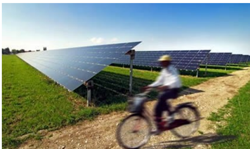
Illustrazione 1: esempio di impianto fotovoltaico "a terra"

Questo contributo è il minimo previsto per grandi impianti. Esso infatti è previsto "a terra"; la peggiore condizione. Ma se dovessimo installare i pannelli su delle pensiline frangisole potremmo aspettarci un interessante aumento.