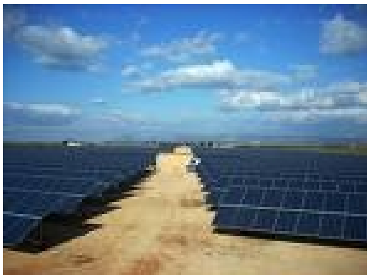
Illustrazione 6: Altro esempio di "campo" fotovoltaico

Il Comune di Vicenza potrebbe pagare €1,00 per ogni tonnellata di CO 2 risparmiata e contribuire così ai costi di gestione amministrativa derivanti dal progetto. Si pensi all'ufficio dei BOC e ai bonifici annuali verso i finanziatori.