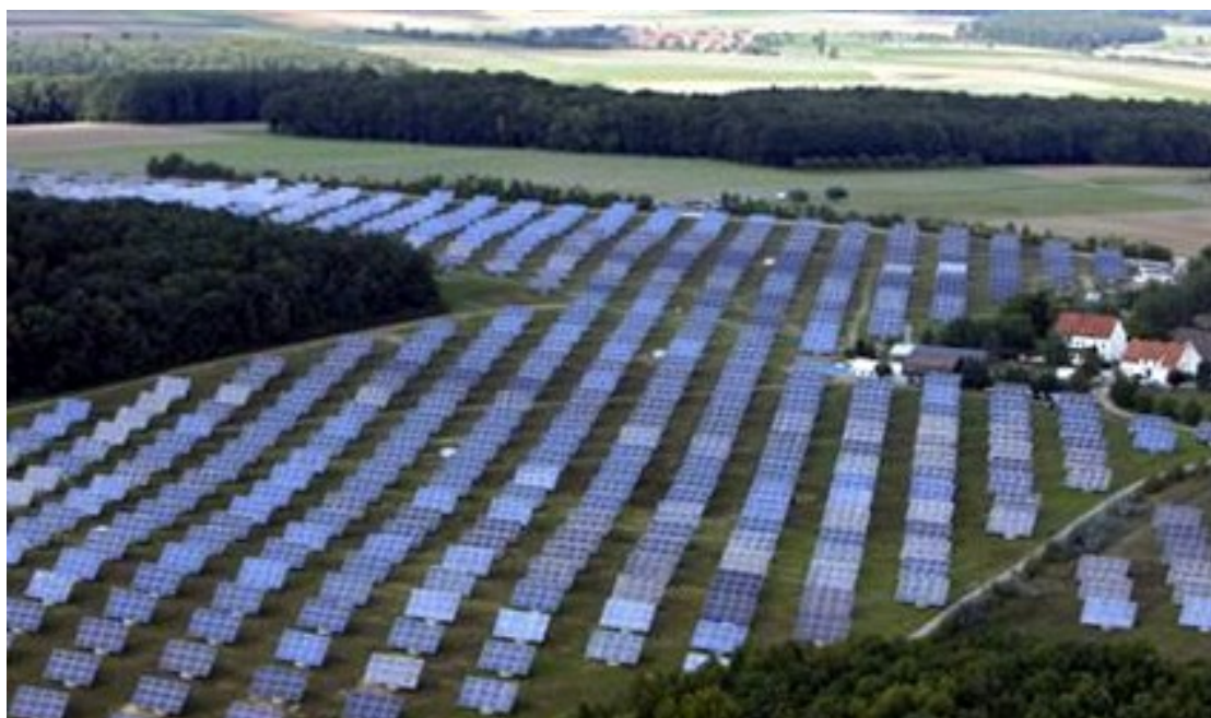
Illustrazione 5: Altro esempio di impianto fotovoltaico

Il totale del ricavo in 20 anni, per un investimento di € 1.000,00 è di oltre € 3.600,00 che ripagati i primi mille portano ad un guadagno di € 2.682,40.