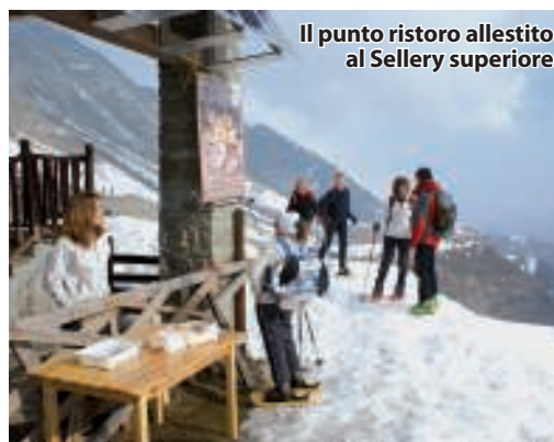
Il punto ristoro allestito al Sellery superiore